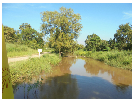
น้ำในคลองหนองจอกใหญ่ มีปริมาณน้ำปานกลาง