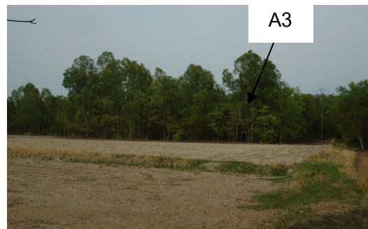
พื้นที่ A3 ที่ยังไม่ได้ดำเนินการทำเหมือง