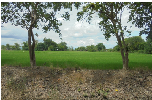
มีพื้นที่ทำนา