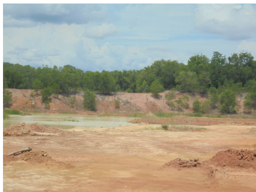
สภาพน้ำในบ่อเก็บขัง ข.6 ในปัจจุบัน