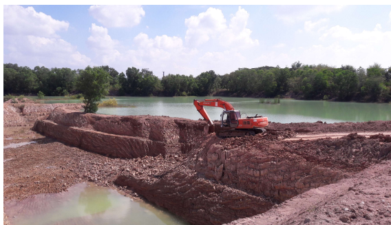
ปรับสภาพความลาดชันของบ่อเหมืองให้มีความปลอดภัย