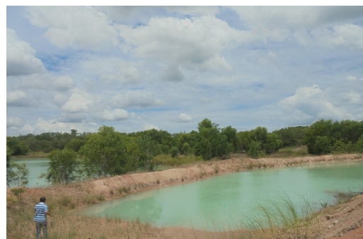
สภาพน้ำในบ่อเก็บขัง ข.2 ในปัจจุบัน