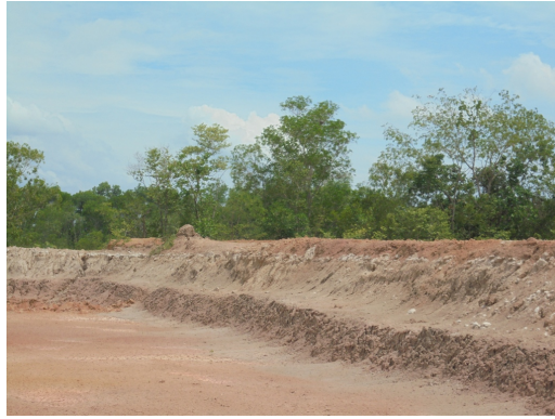
หน้าเหมืองในปัจจุบัน